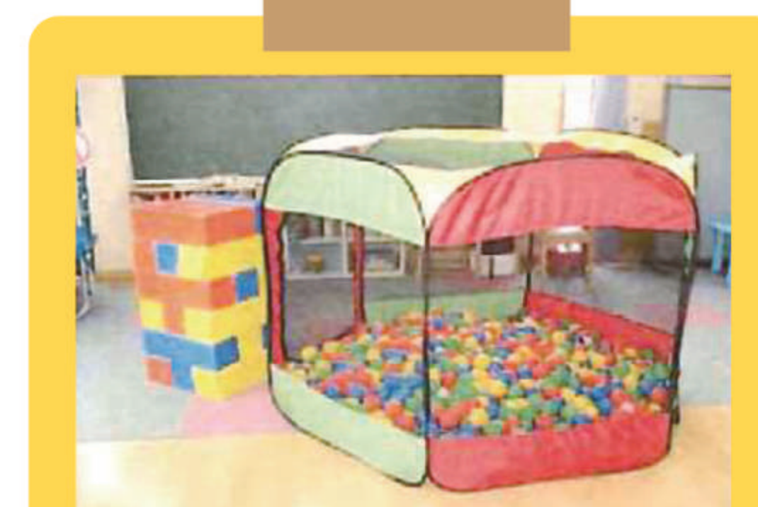
大型ジェンガ・ボールプール